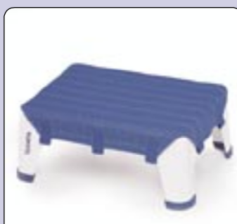
AQUATEC STEP Reduz a distância entre o chão e a beira da banheira.