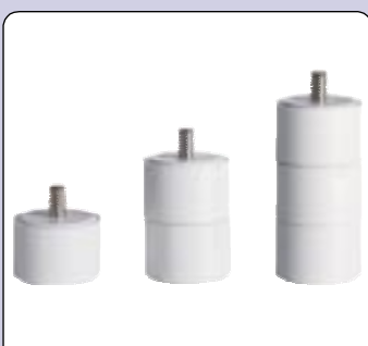
Adaptadores de altura Altura do assento pode ser aumentada até 6 cm.