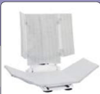
Encosto especial reclinável para BELUGA Com abas laterais.