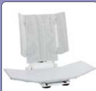
Abas standard para BELUGA Para banheiras especiais. Largura máxima de 100 cm.