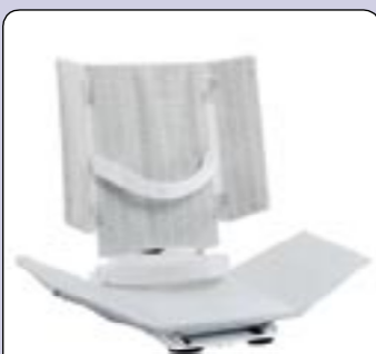
Cintos de segurança para BELUGA Posicionamento mais seguro.