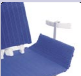
Guia plástica Para aplicar nas pegas montadas na banheira.