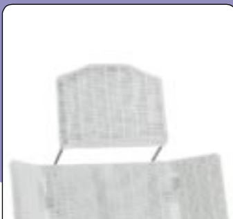
Apoio de cabeça para BELUGA Apoio de cabeça regulável em altura.