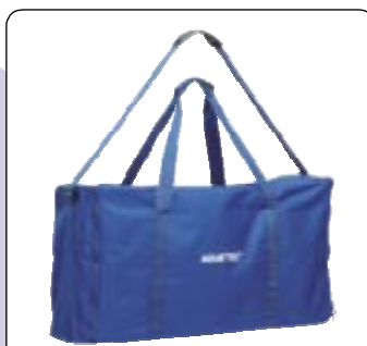
Saco de transporte Com castores. Para transporte e arrumação.